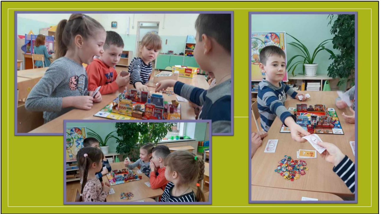
Нашим воспитанникам очень понравились игры с экономическим содержанием