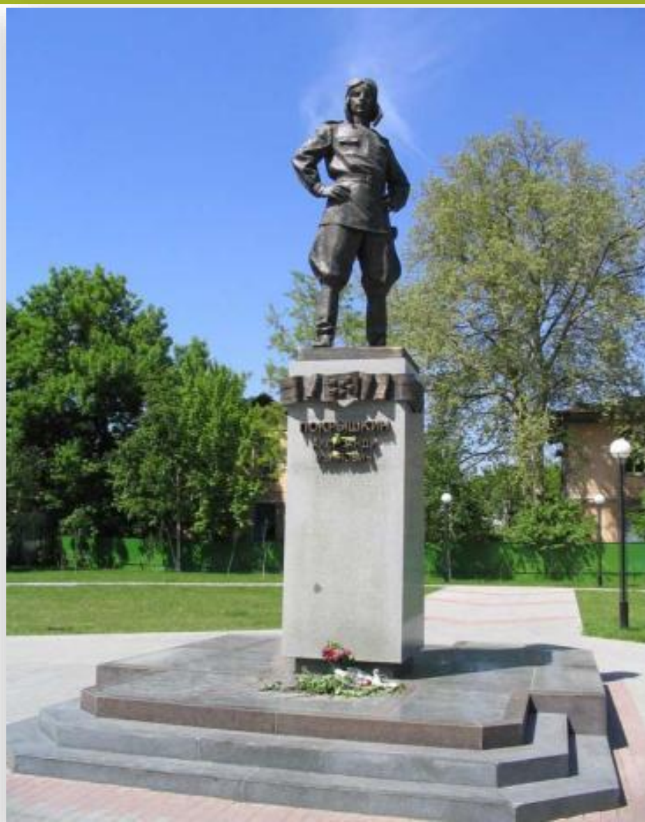
Памятник А. Покрышкину, трижды герою Советского Союза, который сбил 59 вражеских самолетов.