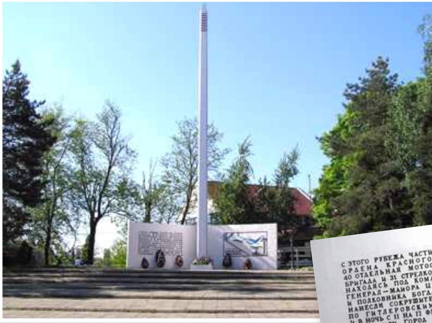
Обелиск воинам 46-й армии Установлен в 1965 г., скульптор И.П.Шмагун. Находится на ул.Ставропольской рядом с парком им. 40-летия Октября

С ЭТОГО РУБЕЖА ЧАСТИ 40 АРМИИ ОРДЕНА КРАСНОГО ЗНАМЕНИ 40 ОТДЕЛЬНАЯ МОТОСТРЕЛКОВАЯ БРИГАДА И 31 СТРЕЛКОВАЯ ДИВИЗИЯ НАХОДЯСЬ ПОД КОМАНДОВАНИЕМ ГЕНЕРАЛ-МАЙОРА ЦЕПЛЯЕВА Н.Ф. И ПОЛКОВНИКА БОГДАНОВИЧА П.К. НАНЕСЛИ СОКРУШИТЕЛЬНЫЙ УДАР ПО ГИТЛЕРОВСКИМ ВОЙСКАМ И В НОЧЬ С 11 НА 12 ФЕВРАЛЯ 1943 Г. ОСВОБОДИЛИ ГОРОД КРАСНОДАР