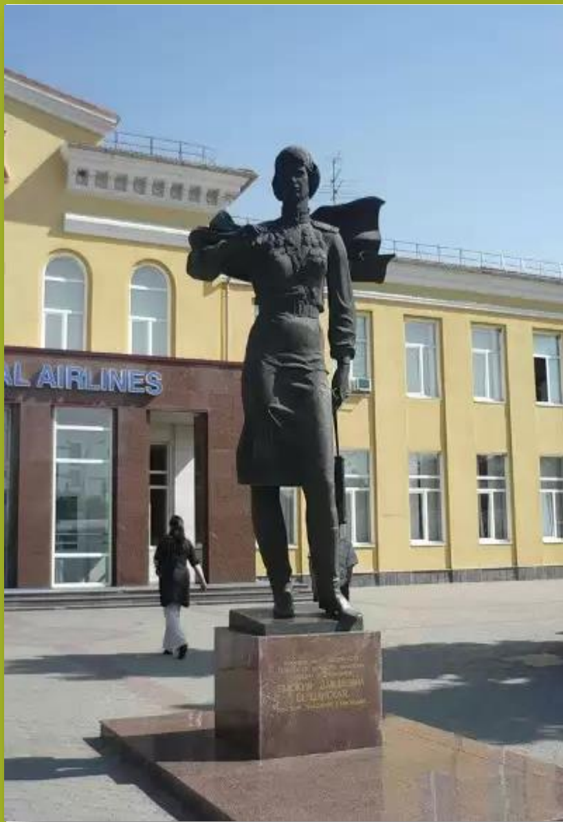
В аэропорту Краснодара в честь Евдокии Бершанской был открыт памятник