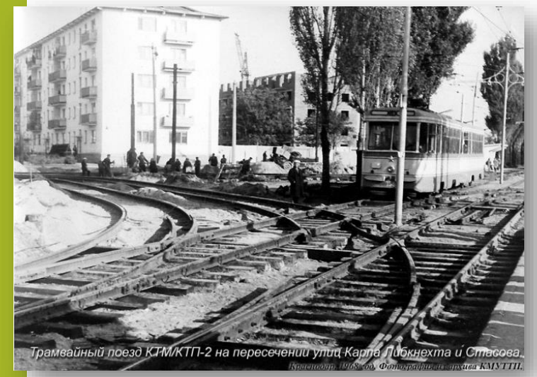
Трамвайный поезд КТМ/КТП-2 на пересечении улиц Карла Либкнехта и Стасова. Бронепоезд. 1968 год.